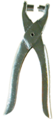
522 011 Ösenzange D 7cm, inkl. 100 Ösen VE 1