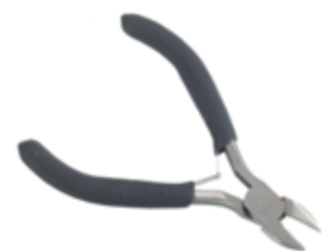
522 013 Seitenschneider klein VE 1