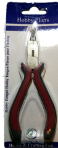
522 002 Kombi- zange, schnei- den, drehen