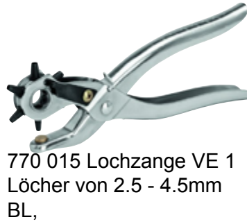
770 015 Lochzange VE 1 Löcher von 2.5 - 4.5mm BL,