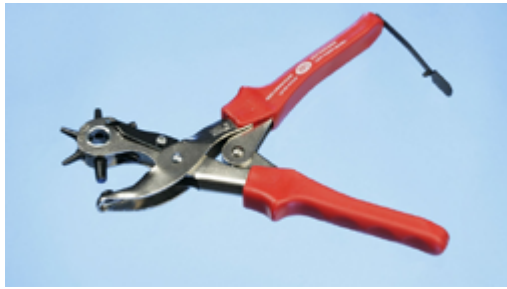
3901952 Lochzange für Stöpsel speziell für Leder/ Hergestellt in DE