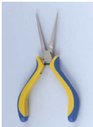
522003 Rundzange lang