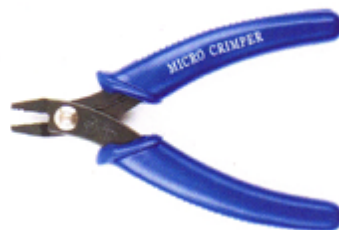
522 010 Micro Crimp Zan- ge VE 1 / Für kleinere Quetschperlen