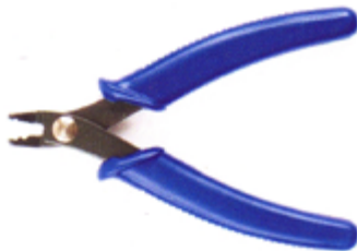
522 009 Crimp Zange VE 1 / Die Zangenkanten sind schön glatt und ermöglichen eine fehlerlose Rundung.