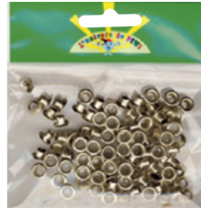
522 014 Ösen D.7cm 100 Stk (f.Zange 522011) VE 1