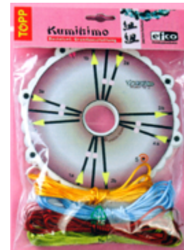
523 002 Flechtscheibe Set VE 1 Inhalt: 1 Scheibe / 2 Schablonen / 6 Satinkordeln à 3m in weiss, rosa, hellgrün, gelb, hellbau und rot / Anleitung