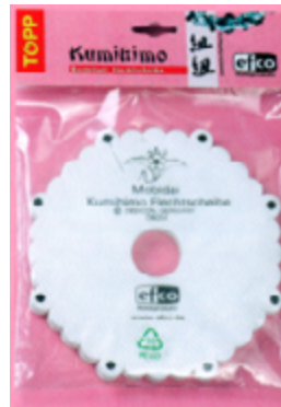
523 001 Flechtscheibe rund VE 2