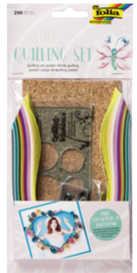
597055 Quilling Set inkl. Anleitung VE1