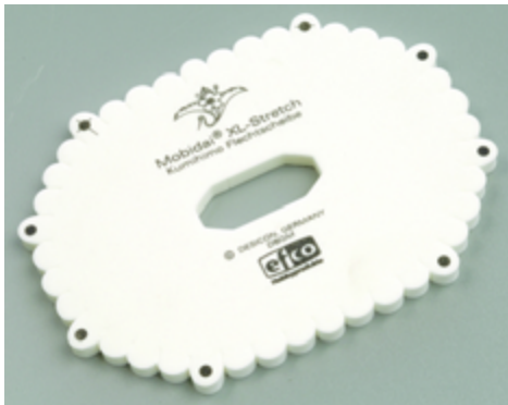
523 000 Flechtscheibe oval VE 1