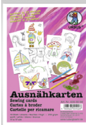
510 124 Ausnähkarten VE 4 weiss 11x17cm, 10 Sujets